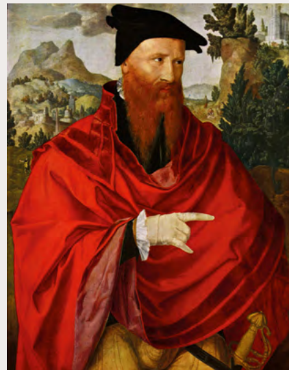
David Joris, bedeutender Täufer am Oberrhein

Ein reformatorischer Aufbruch stand am Anfang des Täufertums. Obrigkeitliche Repression führte die Bewegung oft in Isolation oder in die Fremde. Versöhnungsprozesse in der Neuzeit ließen täuferische Kirchen zu ökumenischen Partnern bei der Bewältigung aktueller gesellschaftlicher Umbrüche werden. Der Vortrag skizziert die Geschichte des Täufertums in der Region, entlang von lokalen historischen Entwicklungen.