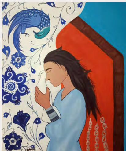
Zarah Ahmadi