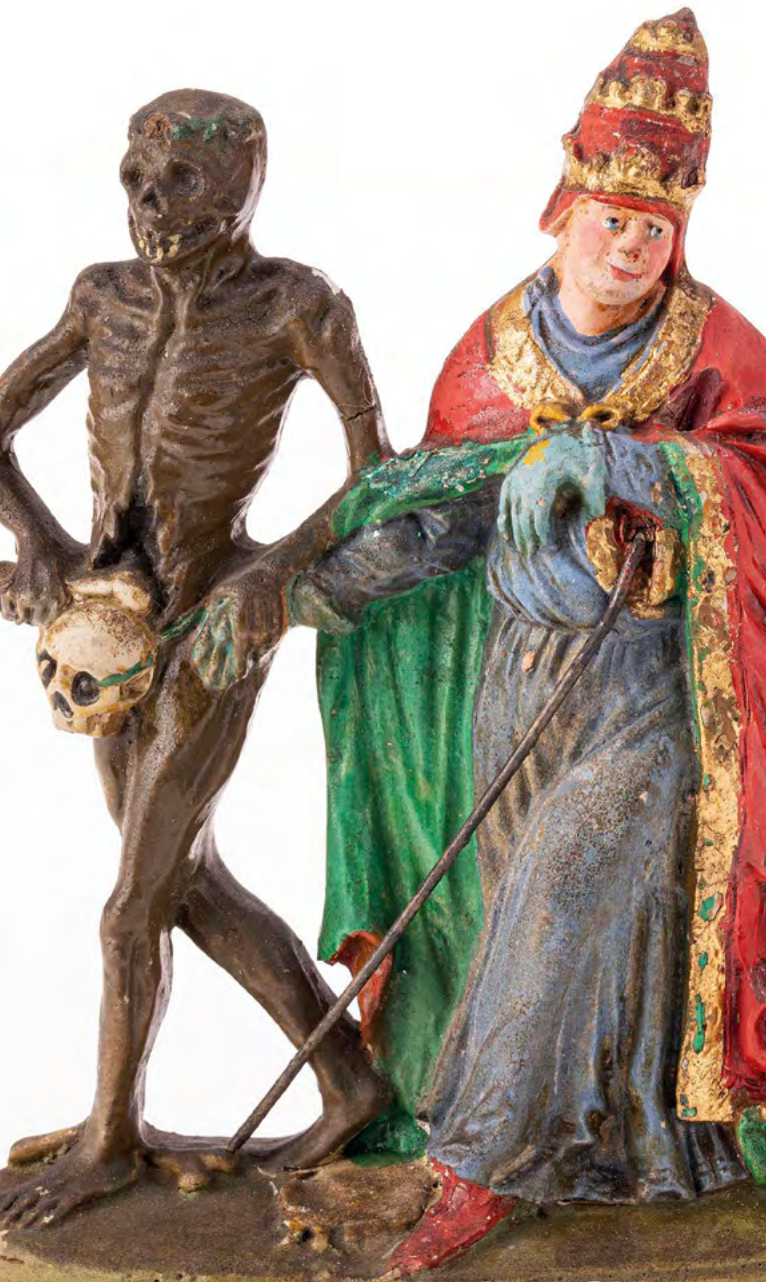
Endzeitstimmung: Dem Basler Totentanz nachempfundene Figurengruppe „Tod und Papst“ (Sammlung DLM KZiz 7)