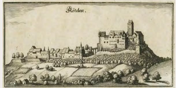
Burg Rötteln von M. Merian (Sammlung DLM GrLLö 90)