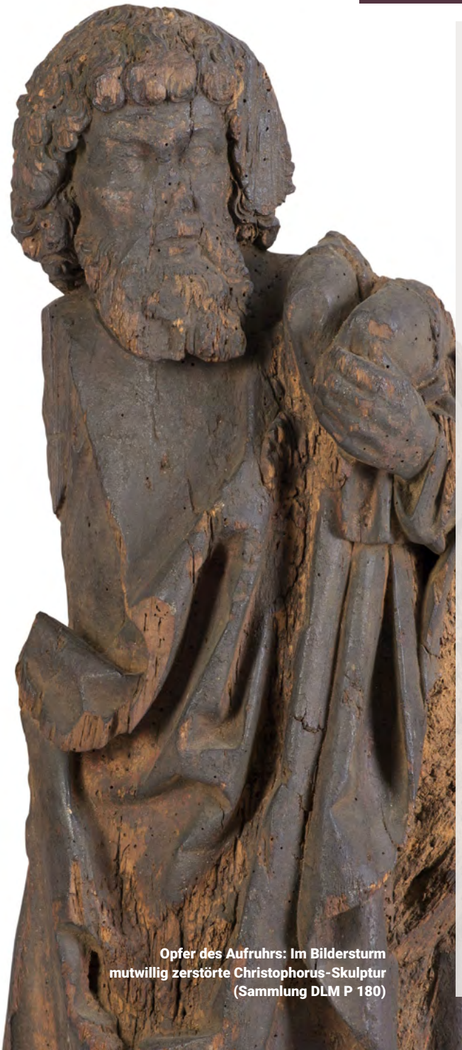
Opfer des Aufruhrs: Im Bildersturm mutwillig zerstörte Christophorus-Skulptur (Sammlung DLM P 180)