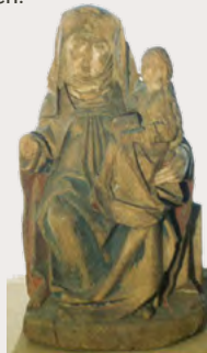
Holzskulptur der Anna Selbdritt, 16. Jahrhundert (Sammlung DLM P 123)