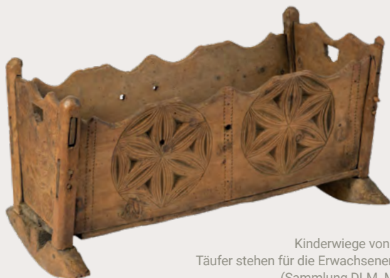
Kinderwiege von 1560: Täufer stehen für die Erwachsenentaufe (Sammlung DLM Mö 21)