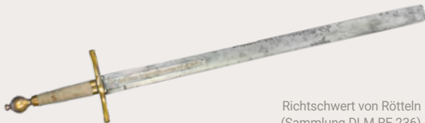
Richtschwert von Rötteln (Sammlung DLM RE 236)